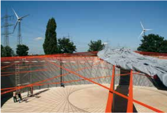
Baustelle einer Biogasanlage