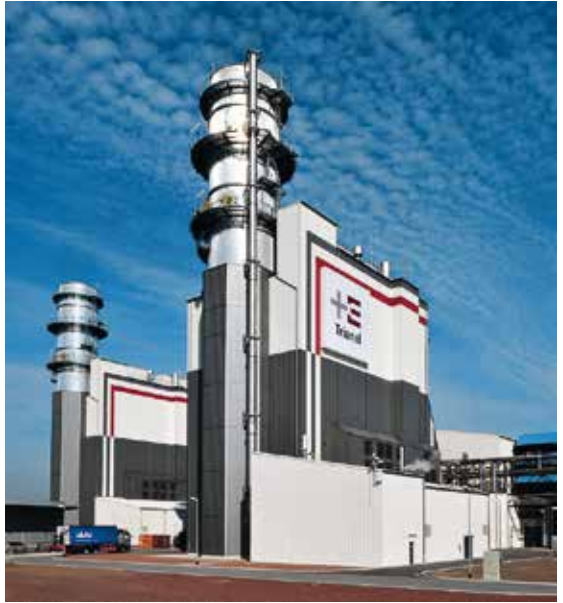
Trianel Gas- und Dampfkraftwerk Hamm-Uentrop