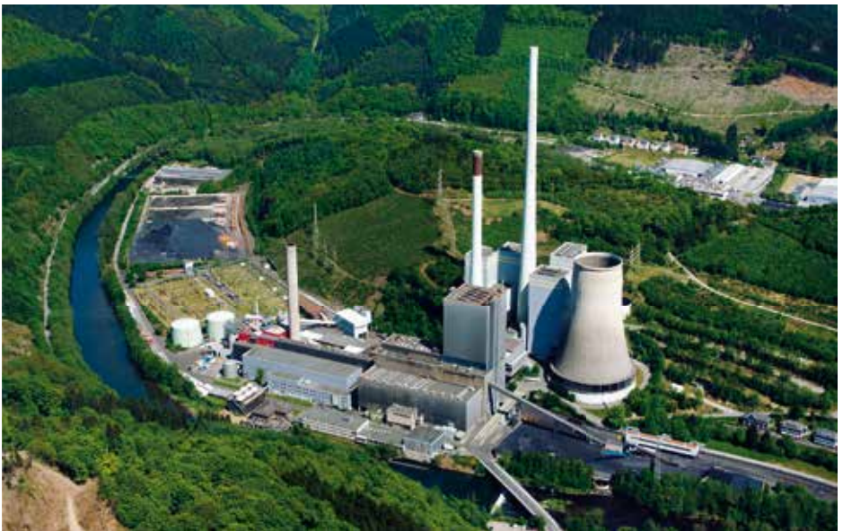
Kohlekraftwerk Werdohl-Elverlingsen, Deutschland